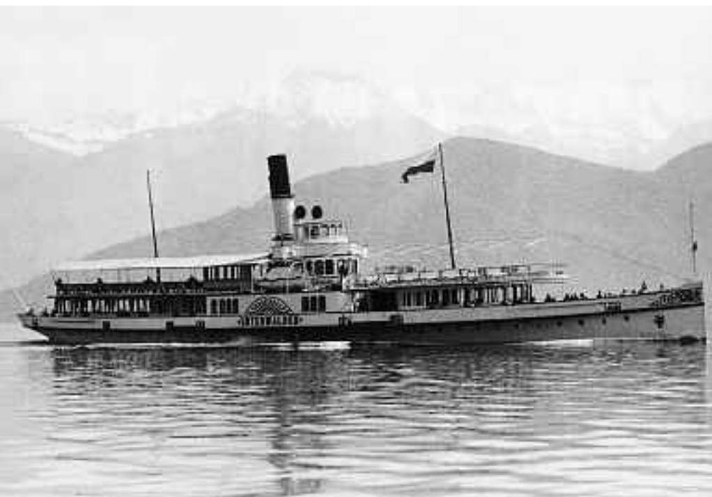
DS UNTERWALDEN Anfang der 40er-Jahre.