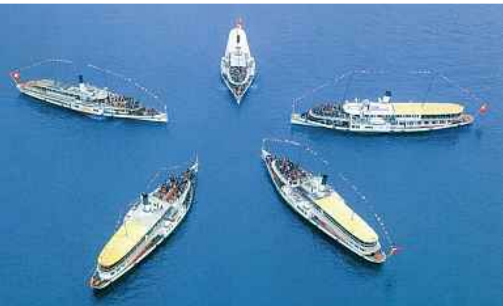
Sternformation an der Dampferparade 1997 vor Gersau.